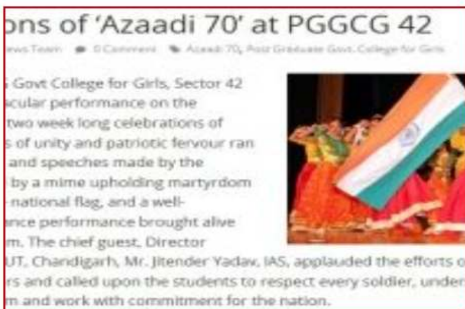
celebrations of Azaadi 70