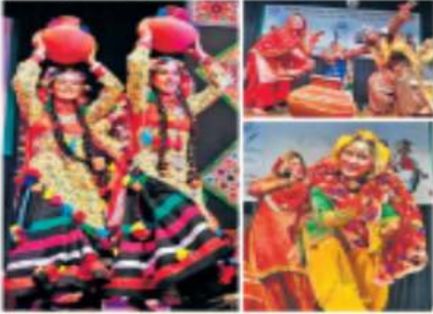
छात्रों ने फोक डांस का प्रदर्शन किया।

युवा फेस्ट - एक ऐसा अवसर, जहाँ नए नृत्य, गाने, खेल-कूद आदि का प्रदर्शन होता है। इस अवसर पर छात्रों ने अपने लोक नृत्य को दर्शकों के सामने प्रस्तुत किया। फोक डांस एक लोक नृत्य है, जो भारत के विभिन्न राज्यों में प्रचलित है। इस नृत्य में महिलाएँ अपने सिर पर बालियाँ रखकर नृत्य करती हैं। यह नृत्य प्राचीन काल से प्रचलित है और इसमें महिलाओं का विशेष स्थान है। फोक डांस को देखकर दर्शकों में बहुत ही उत्साह फैलता है। छात्रों ने इस अवसर पर अपने फोक डांस को बहुत ही शानदार ढंग से प्रस्तुत किया।