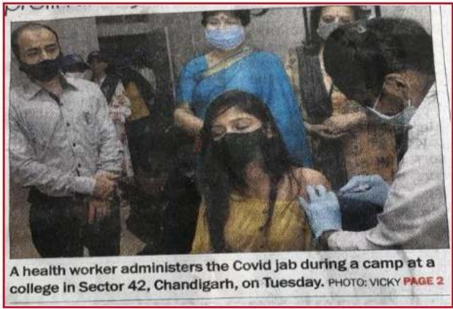
A health worker administers the Covid jab during a camp at a college in Sector 42, Chandigarh, on Tuesday. PAGE 2

"Celebrated Eco-Rakhi" by SRISHTI, the Environment Society in collaboration with the Department of Hindi on 21 August 2021