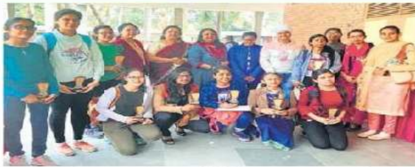
ਰਾਸ਼ਟਰੀ ਵਿਗਿਆਨ ਦਿਵਸ ਸਬੰਧੀ ਸੈਕਟਰ 42 ਸਰਕਾਰੀ ਕਾਲਜ ਵਿਖੇ ਕਰਵਾਏ ਵੱਖ-ਵੱਖ ਮੁਕਾਬਲਿਆਂ ਦੇ ਜੇਤੂ ਵਿਦਿਆਰਥੀ ਆਪਣੇ ਇਨਾਮਾਂ ਨਾਲ। ਲਿਖਕਾਰ : ਗੁਰਿੰਦਰ ਸਿੰਘ