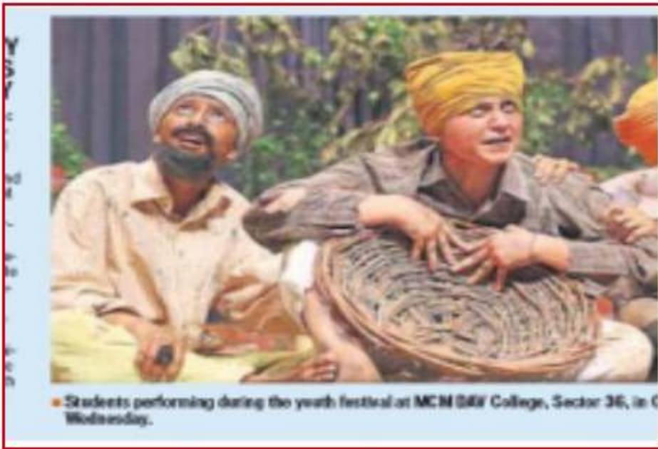
Students performing during the youth festival at MCN B&V College, Sector 36, on Wednesday.