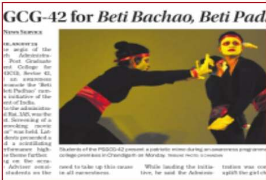
Beti Bachao Beti Padhao campaign