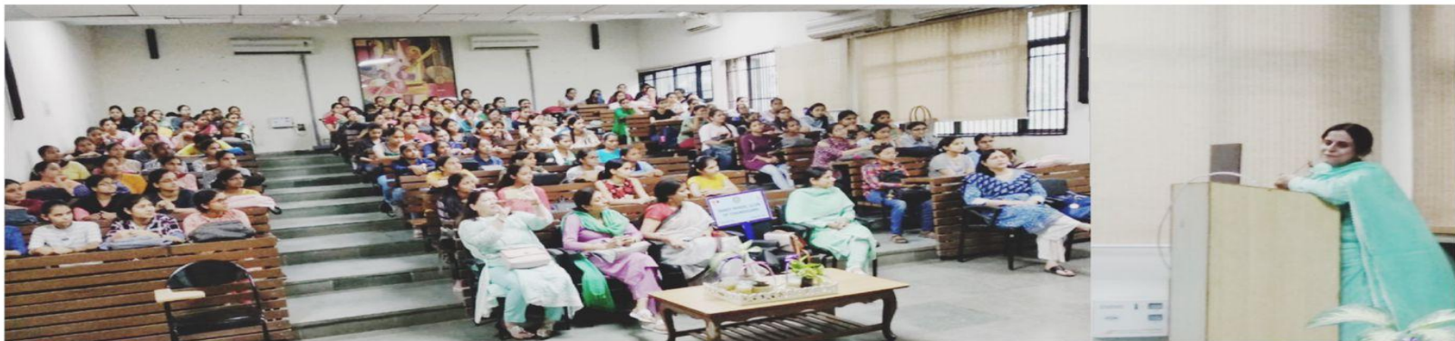
Aids Awareness/ Public health/Community hygiene & Sanitation Society of P.G.G.C.G, Sector-42, Chandigarh